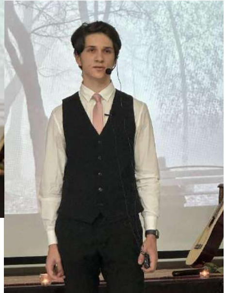
Литературная гостиная, посвященная творчеству С. Есенина